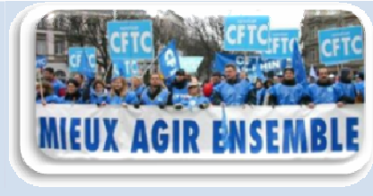
Syndicat CFTC - Tisséo