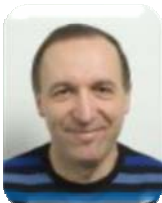
Georges Pujol Statistiques