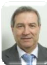
F. SANCHEZ Serv. affrétés