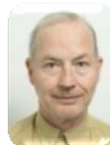
A. Mazureau Mobilité et stats